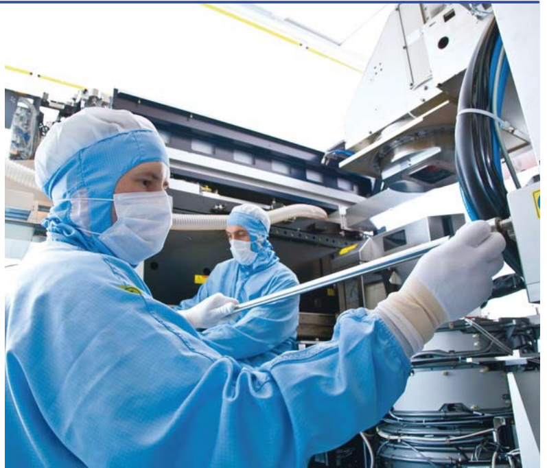
Bouwen aan een chipmachine bij ASML

De ASML Foundation is de nieuwe mede-sponsor van het Vocational Training Centre (VTC). ASML Foundation sponsort de technische school in 2016 en 2017 voor een totaalbedrag van € 15.000,00. De Foundation helpt SAKO en Alosikhha hiermee om de school te continueren en na 2017 mogelijk onder te brengen bij de Bengaalse overheid. *